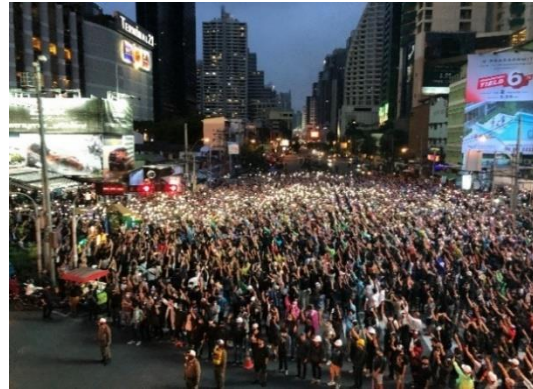
【写真：バンコク市内の政治集会の様子】