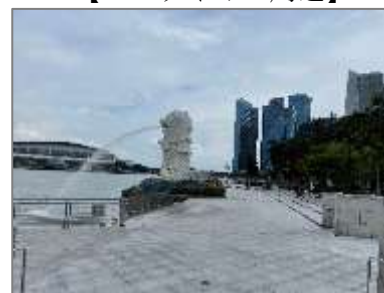
【マーライオン周辺】

国内の行動については規制を強める一方、入国制限については緩和の方向に進んでいます。10月2日には、日本を含む一部の国からの入国時の隔離期間を14日間から7日間に短縮するとの発表がありました。以前のような海外との往来ができるよう、今後さらなる入国制限の緩和が期待されています。