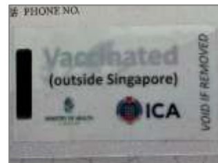
【証明となるシール】