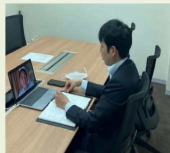
(インタビューの様子)

試用期間の問題があります。例えば工場勤務のワーカーを雇用する場合、試用期間は6日となっており、雇用側からすると、正規雇用をすべきかを判断するための十分な時間を確保できません。一方、ワーカーからは正規採用後でも、業務内容が向いていないと判断すれば無断欠勤や自主退社されることもあるようです。また、労働組合はストライキを行う権利があります。かつてはベトナムでも急激なインフレを背景に多発していましたが、現在はインフレが落ち着いたため日系企業ではほとんどありません。