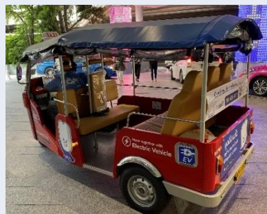
バンコク市内を走る電動トゥクトゥク

また、タイの代表的な乗り物であるトゥクトゥクも、排気ガスの出ない電動トゥクトゥクが徐々に普及しており、現在では約200台が稼働しています。電動トゥクトゥクはタイ政府による助成金で開発され、2025年には全国の約2万台のトゥクトゥクをすべてEV化することも宣言されています。