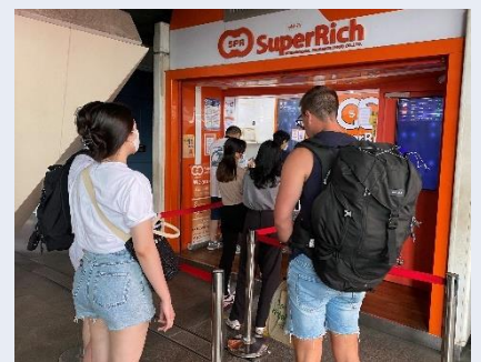
バンコク市内の両替所を訪れる旅行者