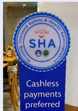
左：飲食店の認証基準 右：SHA認証マーク

タイのSHAと日本の認証制度を比較すると、日本は自治体などによって認証制度が異なっており、訪日したタイ人にヒアリングすると、非常にわかりにくいとの意見が挙げられました。新型コロナウイルス感染症が終息したとしても、今後の新たな感染症に対し、このSHAは有効だと感じます。