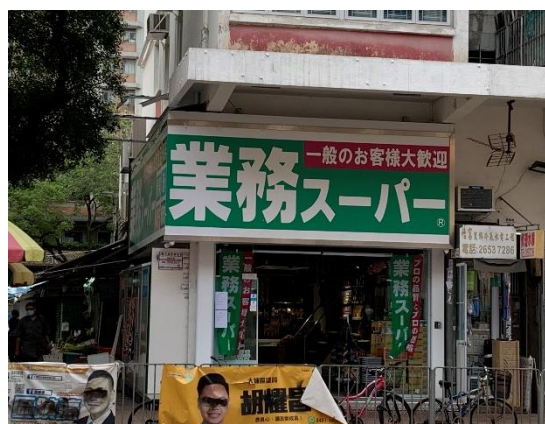
<業務スーパー香港1号店>

2021年5月に、神戸物産が運営する「業務スーパー」の香港1号店が開業しました。日本でも独自の商品展開で人気を集めていますが、香港でもこれまで紹介されていなかった日本産食品が提供されるのではと注目を集めています。日本産食品を扱う地元小売店が増加する中、他社との差別化を図っていくことが成功の鍵になると思われます。