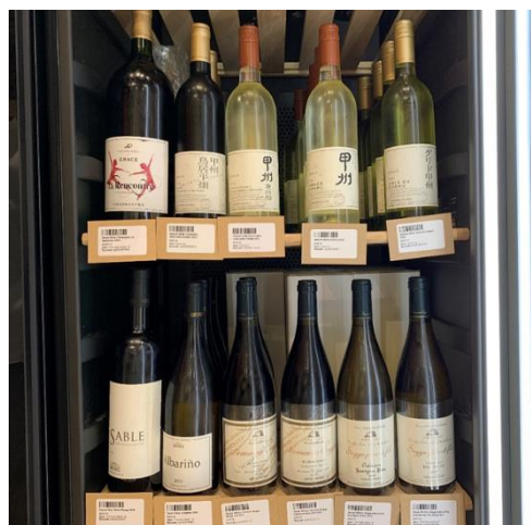
<日本産ワインの販売風景(山梨・北海道のワイン)>

ワイナリーにおける生産量が限られていることや価格が高いこともあり、和食や中華料理など中~高価格帯の飲食店での取扱いが中心となっており、価格は700~1,100香港ドル(10~16千円程度)です。小売では、一部の高級スーパーや酒類専門店などでの取り扱いが中心で、販売チャネルは限られています。価格は、300~700香港ドル(4~10千円程度)です。