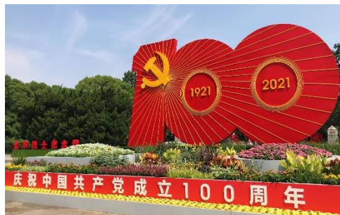
<上海三大寺院「龍華寺」のモニュメント>