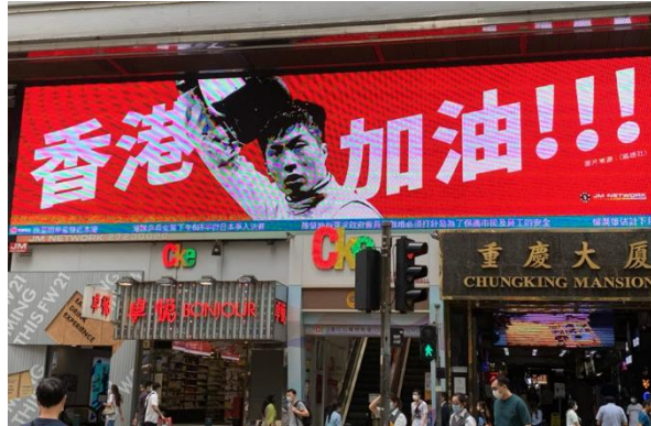
<繁華街のデジタル広告（フェンシング選手が出演）>

前回大会までの香港の通算メダル獲得数は3個だけでしたが、今回は、金1個、銀2個、銅3個の合計6個と史上最高の結果でした。開幕間もなく、フェンシングが金メダル、水泳が銀メダルを2個獲得し、大きな話題となりました。その後も、卓球団体と空手が同日に銅メダル、最終日にも自転車が銀メダルを獲得し、香港中が熱狂しました。開催期間中は、ショッピングモール内のモニターに競技が放映され、人だかりができるほどで、東京オリンピックによって、香港に活気がもたらされました。