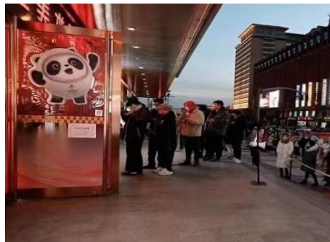
<ビン・ドウンドウンのグッズを買う行列>

この冬、中国で最も人気となったのは、ハーフパイプで金メダルを取った谷愛凌選手ではなく、フィギアスケートで女性に人気の羽生結弦選手でもなく、五輪マスコットの氷墩墩（ビン・ドウンドウン）と言えるでしょう。五輪期間中、キャラクター商品は販売と同時に売り切れとなり、今でも入手困難な状況です。また、人気にあやかった商品もたくさん出ており、例えば、後頭部に氷墩墩のデザインをした髪型、スタンプ、コーヒラテなど、見ていて楽