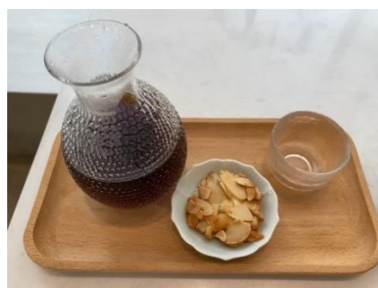
写真 酒器風の器で提供されるコーヒー

2010 年頃から、海外で修行を積んだ若手のバリスタを中心にスペシャルティコーヒーを提供する店が徐々に登場し、2015 年以降は香港全土に拡大しています。最近では、香りや味わいをより楽しむために、日本酒の酒器のような器で提供するなどの工夫が凝らされています。消費者の嗜好や変化に応じて、商品のバリエーションや提供方法などが今後も洗練されていくものと考えられます。