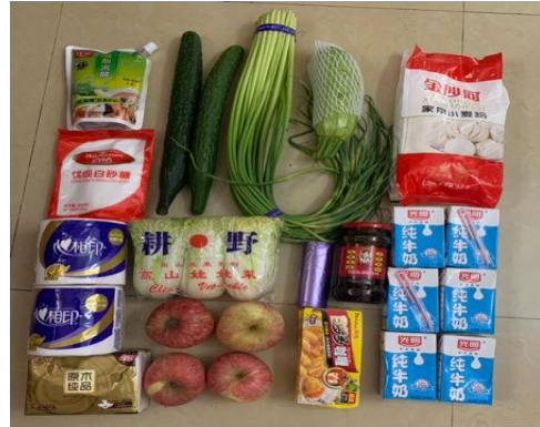
<上海政府が配給した物資>