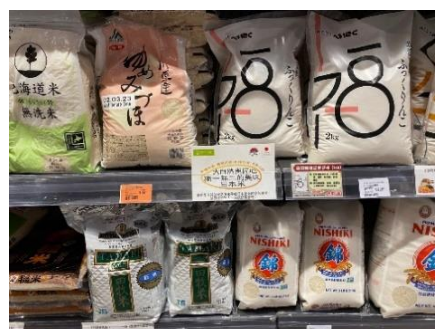
スーパーの日本産米(上)と米国産米(下)

香港における日本産米の販路は、約 7 割が外食および中食向けとされており、スーパーなどで販売される内食向けは限定的です。また、日本産米の消費者は一定以上の給与所得者や日本人駐在員が中心で、一般的な家庭では他国産米が選ばれています。ただし、見方を変えれば、香港の一般家庭需要には開拓の余地が残されているということでもあり、需要を掘り起こすことが出来れば、輸出拡大の底上げに繋がる可能性があります。