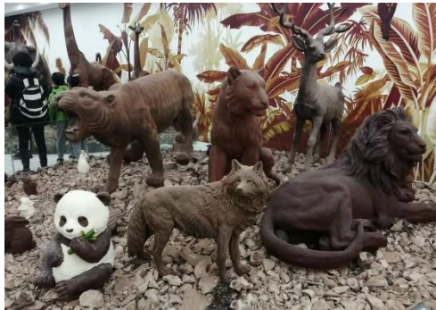
<1階に展示されているチョコレートの動物>

今年の2月、上海豫園の近くにチョコレート博物館がオープンしました。博物館の周りに溢れる甘く濃厚な香りに惹かれ、家族連れを中心に今人気のスポットとなっています。一階には、チョコレートで作られた可愛いパンダや威風堂々としたトラなど、さまざまな動物が本物さながらに展示されており、思うままに写真を撮ることができます。地下には、チョコレートの原料や歴史などがスクリーンで紹介されるほか、その製造過程をガラス越しに見たり試食することもできます。他にも、チョコレートで作られた芸術品が所狭しと展示されており、インスタ映えすること間違いありません。