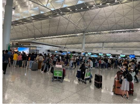
<日本行き便に並ぶ乗客（香港国際空港）>

香港では、2019年の訪日旅行客数が229万に達するほど、日本は非常に人気のある旅行先です。日本入国手続き緩和後も香港への帰国後には7日間の強制隔離が必要でしたが、当地旅行大手EGLが7月に企画した大阪や和歌山、岡山などを巡る7泊8日のツアーには、再開後最大となる20