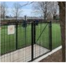
街中のドッグラン