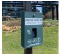
公園や公道に設置されているペットの排泄物用袋