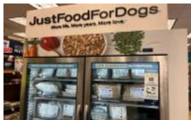
ペットショップのフードコーナー