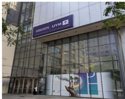
ニューヨーク大学

マンハッタンとブルックリンに多くの校舎が点在する都市型大学。ビジネス、法学、特に芸術学部の映画学科や演劇学部が世界的に有名で、卒業生のアカデミー賞受賞者は30名以上。女優のアンジェリーナ・ジョリーや歌手のレディ・ガガなども在籍していました。全米でも最大規模で、学生数約6万人（うち留学生約2万人）。統合デザイン/メディア専攻科で学ぶ知人の話では、授業はアットホームな雰囲気、教授の質も高く、中国、韓国、南米、アフリカなど世界各国から来たクラスメートと様々な課題策定や批評を行い、とても刺激的な学生生活を送っているそうです。学部の学費は年間約$60,000が目安。