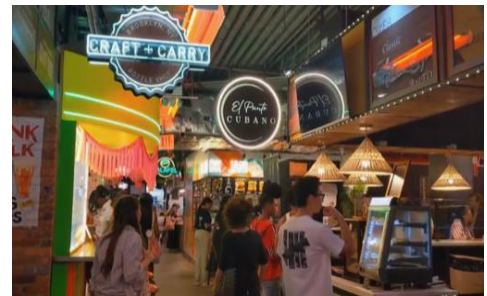
中心地の飲食店街に集まる人