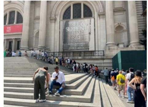
メトロポリタン美術館に入るために並ぶ行列