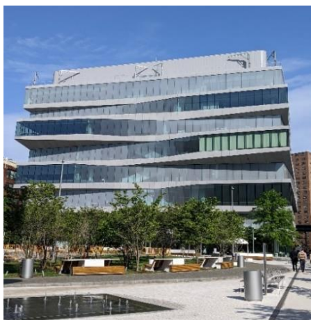
コロンビア大学ビジネススクール

アメリカの大学は、英語能力のほか国際的な素養を身に着けられると考えられていることから、日本をはじめ世界各国からの留学生が数多く通っています。今回は、国際色豊かなニューヨークのアイビーリーグ 1 の有名私立大学や、芸術やファッションの分野で世界的に有名な大学の概要を紹介します。