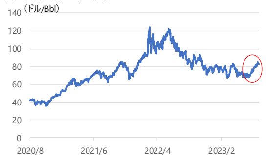
図3 原油価格(WTI)の推移