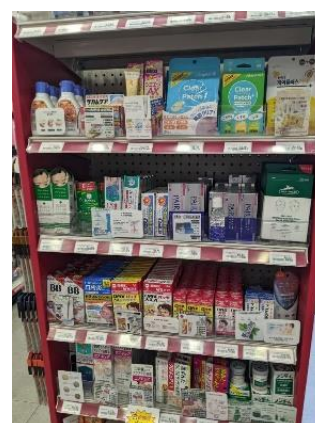
日本のお菓子や薬が揃う