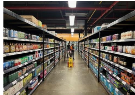
写真1 クラフトビールが並ぶ現地小売店