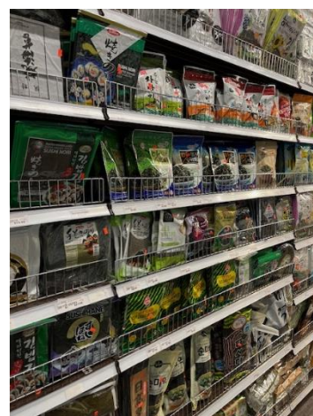
日本の商品を含め品ぞろえが豊富（海産物）

こうした米国でのアジア系小売販売網の拡大は、日本の食品生産者や製造業にとって、海外進出を検討する際の支援材料となる可能性があり、注目していきます。