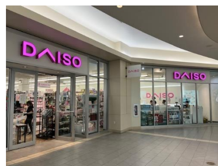
ニューヨーク近郊にも複数店舗